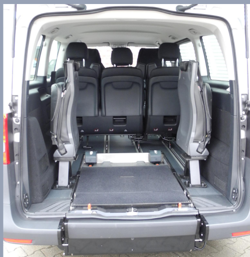
Système Easy-Flex breveté, la rampe se rabat et devient le fond de votre coffre.