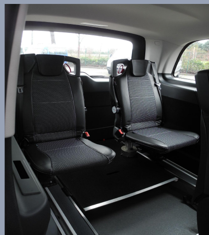
OPTION : 1 ou 2 sièges rabattables pivotants contre les parois permettent de retrouver une configuration avec 7 places.